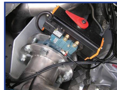
Решение MAC 1